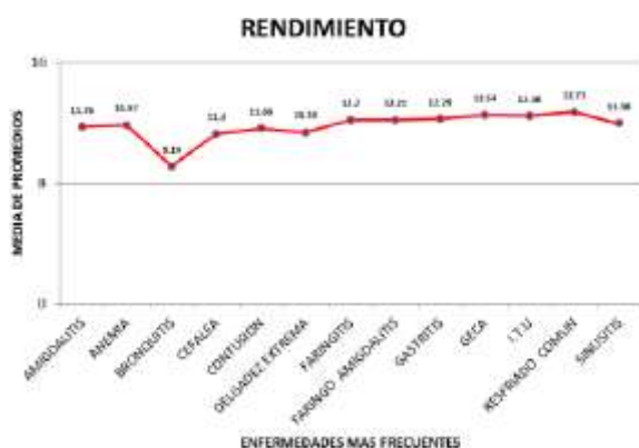
Fig. 3: Notas promedio versus enfermedades más frecuentes

La Fig. 3, nos muestra que las notas promedio más bajas corresponden a los estudiantes que presentaron cuadros de Bronquitis, con notas promedio de 9.14, observándose además que los promedios para cada una de las enfermedades no alcanzan a llegar a la nota de 13, lo cual es un indicador del bajo rendimiento .