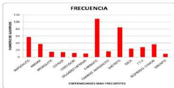
Fig. 1: Relación entre el número de alumnos versus enfermedades más frecuentes.

Los estudiantes tomados como muestra, según los registros de la Oficina de Bienestar Universitario (OBU) de la UNAJMA, presentan como enfermedades más frecuentes a la Admigdaltis, Anemia, Bronquitis, Cefalea, Contusión, Delgadez, Faringitis, Faringoadmigdaltis, Gastritis, Geca, I.T.U., Resfriado, Sinusitis, de las cuales, el mayor porcentaje correspondió a la Faringitis con 24.2 %, Gastritis con 18.7%, y la menos frecuente fue la Sinusitis con 2.0 %. ( Fig. 1.).