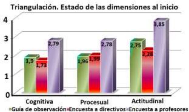
Gráfico 1: Comportamiento de las tendencias centrales de las dimensiones en la triangulación.